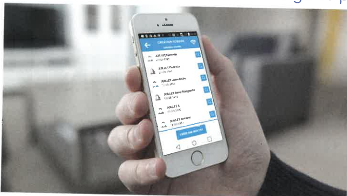
L'application mobile de télémedecine Covalia.

Directeur chargé du projet appui aux GHT - Responsable département SI